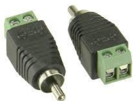
Adattatore RCA/cavo. Rosso=Pos. Nero=Neg.

POSIZIONE SWITCH:(fa fede la sola etichetta)